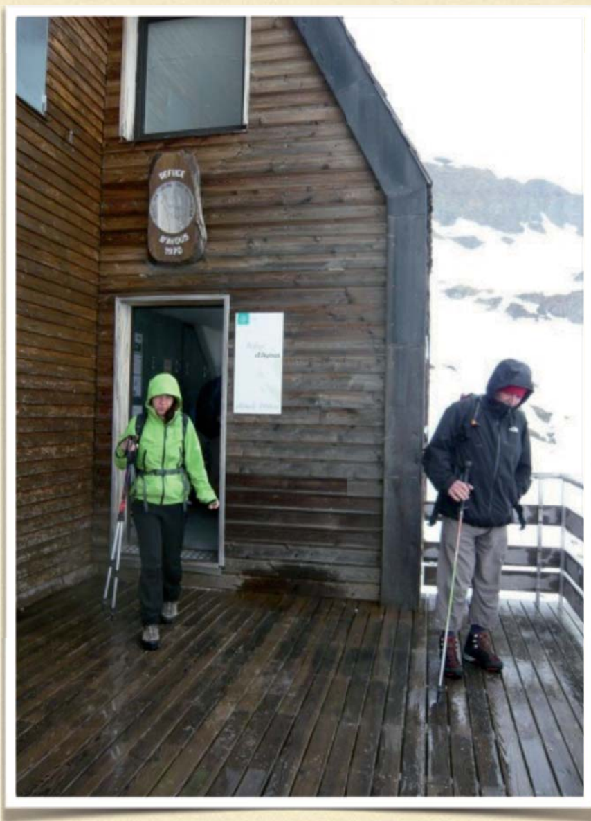
Pique-nique chaleureux dans la partie ouverte du refuge d'Ayous...