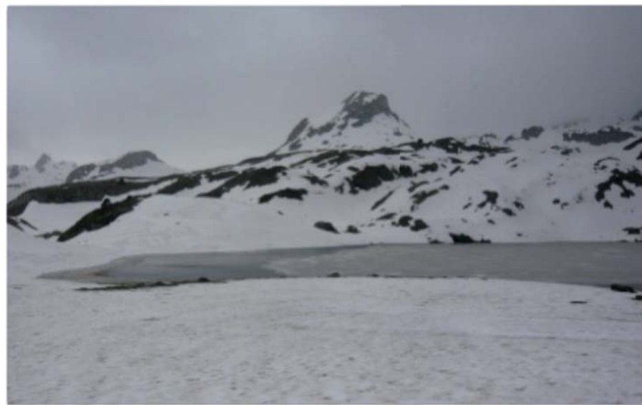
Lac Roumassot (1845m).