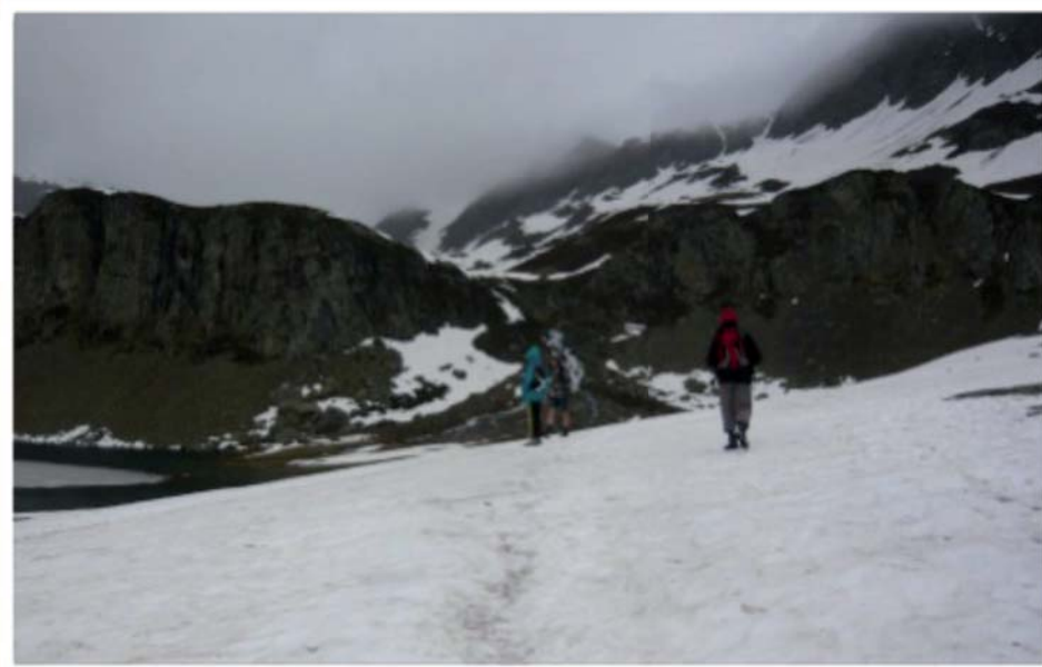
Le sentier monte vers le Nord-Ouest, rive gauche du torrent chutant du lac du Miey (1914m).